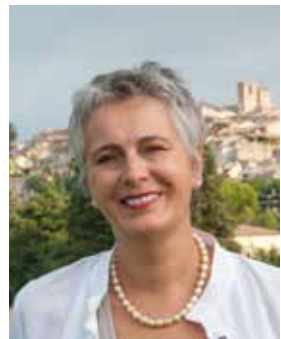
Chères Biotaises, chers Biotois,

Biot est une ville dynamique, une ville qui s'adapte au monde qui l'entoure et qui se modernise. Notre défi aujourd'hui est d'accompagner l'évolution des