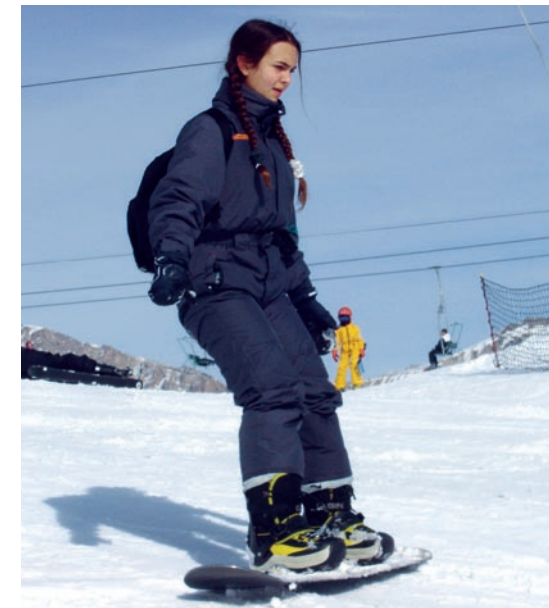
Concentrée mais efficace

Du 12 au 18 février, 48 jeunes sont partis en vacances pour découvrir les joies de la glisse. Destination les Hautes Alpes, plus particulièrement Guillestre où nos jeunes ados ont été hébergés.