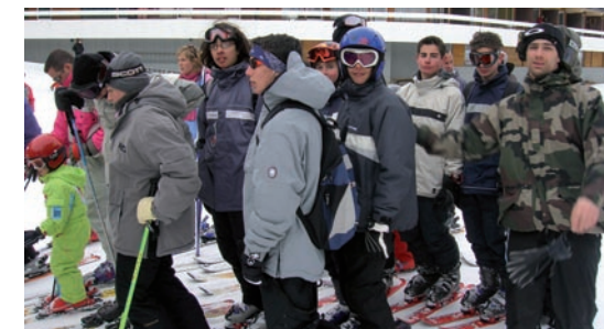
Départ pour une journée de glisse

C'est dans une magnifique bâtisse construite dans le style du Queyras que l'équipe encadrante les a accueillis. A leur disposition, salles d'activités, salle télé, chambres équipées de salle de bain... bref tout le confort.