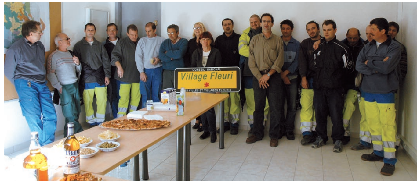
L'équipe des Services Techniques