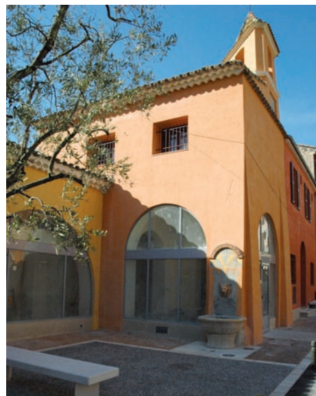
« Les Amis du Musée de Biot » 9, rue St Sébastien 06410 Biot Tél : 04 93 65 54 54

Avec l'arrivée du printemps, les activités du Musée se multiplient.