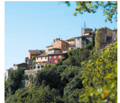
Vue de Biot