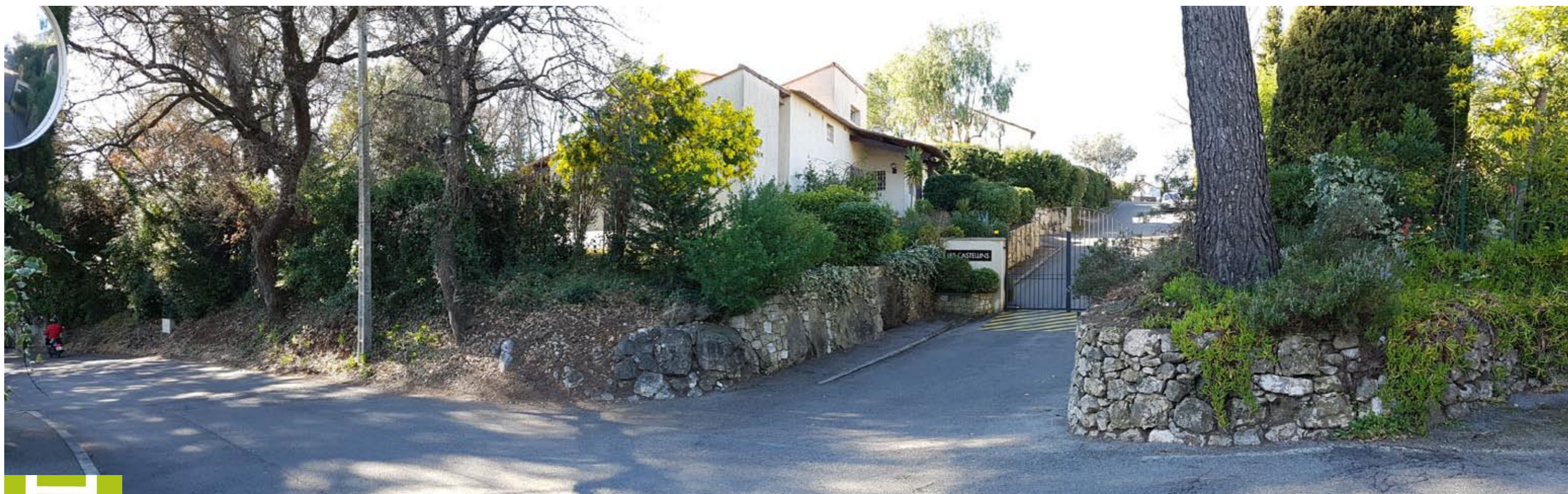
ETAT ACTUEL ENTREE DOMAINE DES CASTELLINS