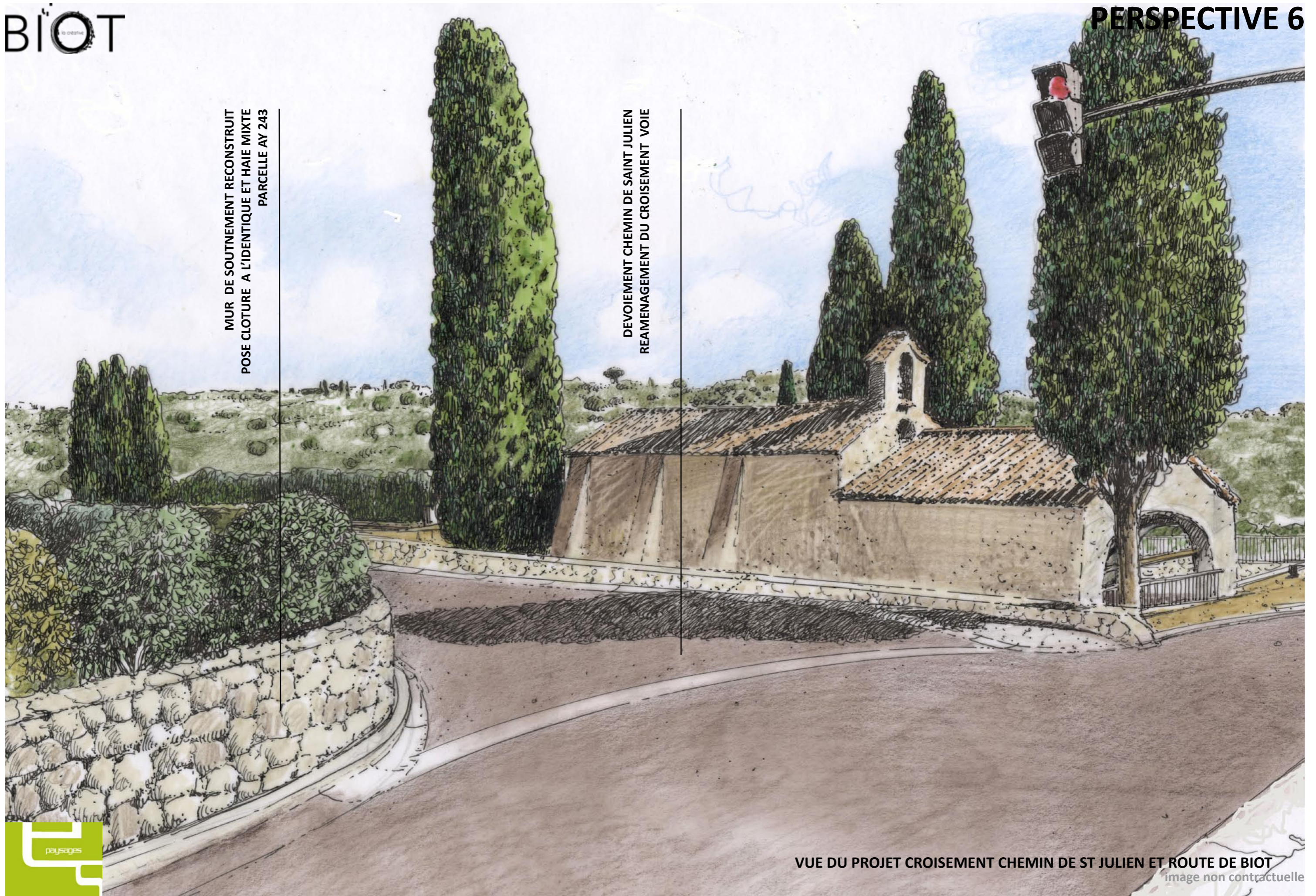
VUE DU PROJET CROISEMENT CHEMIN DE ST JULIEN ET ROUTE DE BIOT

DEVOIEMENT CHEMIN DE SAINT JULIEN REAMENAGEMENT DU CROISEMENT VOIE