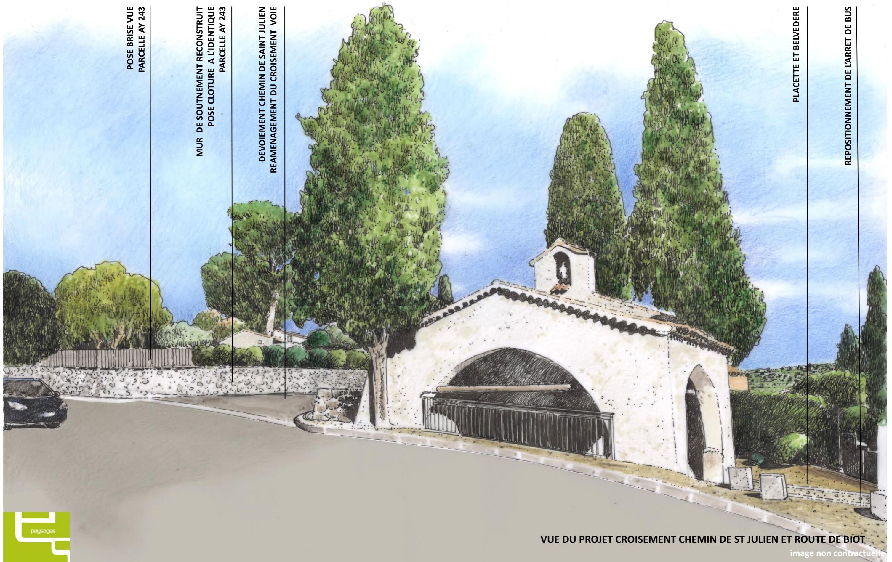
VUE DU PROJET CROISEMENT CHEMIN DE ST JULIEN ET ROUTE DE BIOT