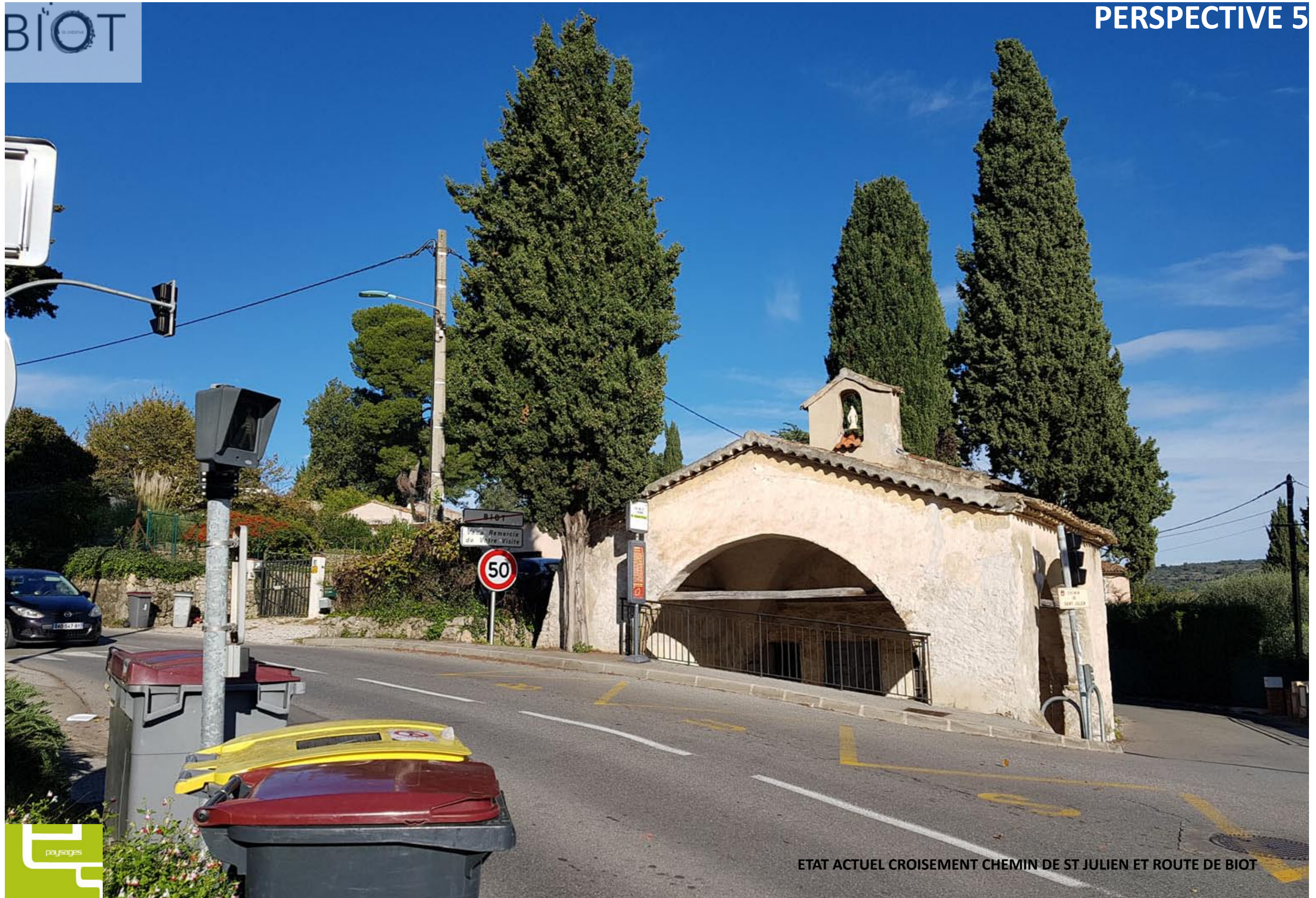
ETAT ACTUEL CROISEMENT CHEMIN DE ST JULIEN ET ROUTE DE BIOT