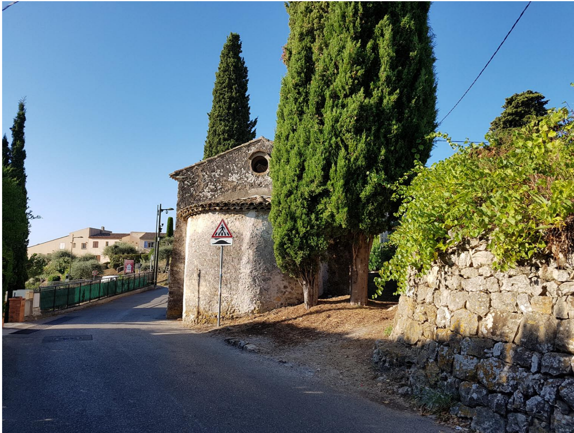
ETAT ACTUEL CHEMIN DE ST JULIEN ET CHAPELLE